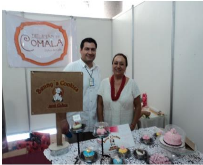
Figura 8.1 Stand de dulces y postres, Delicias de Comala, en la feria del emprendedor 2017, en la ciudad de colima.