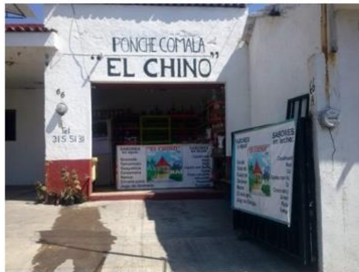
Figura 8.2 Fotografía tomada al negocio de Ponche El Chino, en Comala en una visita a la feria del Ponche, Pan y Café, 2017.